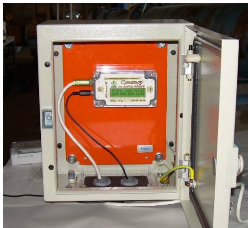
Отчетният прибор, инсталиран в ел. табло IP56, за монтаж на открито